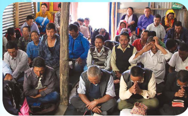
पास्टर अगुवाहरूको सेमिनार