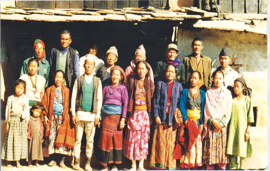
FIRST CHRIST FOLLOWER OF BETHLEHEM CHURCH FAMILY

नेपालको विभिन्न ठाउँमा चेला निर्माण प्रक्रियाद्वारा, जीवन रूपान्तरण र स्वस्थ मण्डली स्थापना गर्नु हो (मत्ती २८:१९-२०) ।