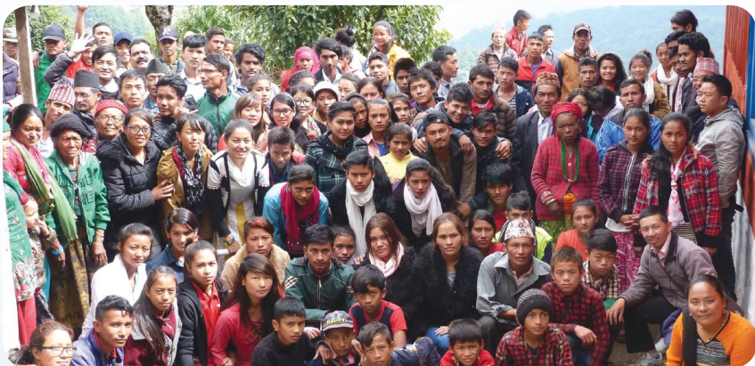
बेथलेहेम संयुक्त जवान जागृती सम्मेलन २०७४