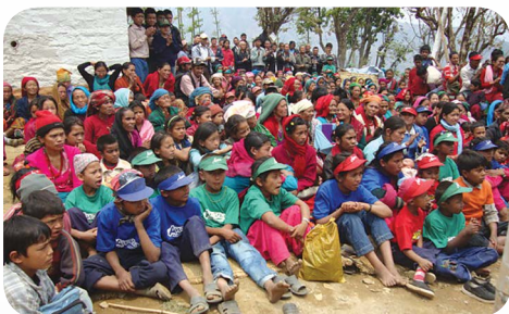
रामेछापमा संयुक्त पुनर्स्थापन उत्सव