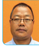
सदस्य पा. पितर सुनुवार