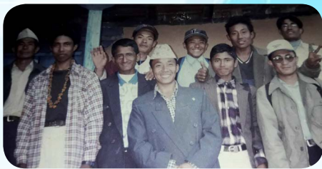
बेथलेहेम मण्डलीको शुरूका पास्टरहरू